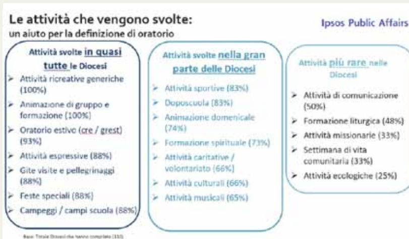
Figura 2. Attività svolte dagli oratori italiani - % di diocesi in cui gli oratori svolgono ognuna delle singole attività

Il "cuore" delle attività oratoriali sembra essere formato da tre tipologie di attività: quelle di animazione di gruppo e formazio-